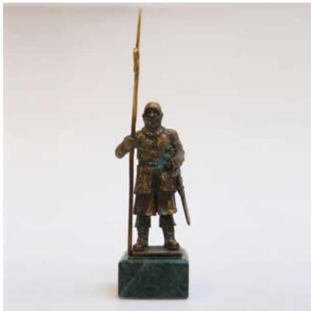
АДРИАН ХРИСАНДОВ „РИЦАР I” 12 X 5 X 3 CM