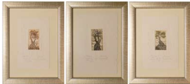
МАРИНА ЙОРДАНОВА СЕРИЯ ОФОРТИ 4 X 7,5 CM

НАГРАДА НА СПОНСОРИТЕ "EURO STARS" SPONSORS PRIZE