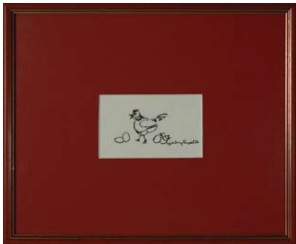
ДИМИТЪР РАШКОВ „ПТИЦА V” 5,6 X 7,8 CM