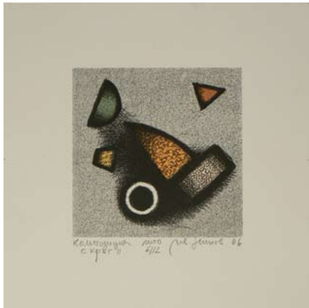
ИВАН НИНОВ КОМПОЗИЦИЯ С КРЪГ II 10 x 10 CM