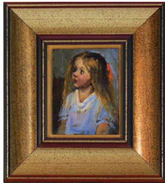
ЛОРА МАРИНОВА ДЕТСКИ ПОРТРЕТ 9,5 x 7,5 CM

LORA MARINOVA CHILD'S PORTRAIT 9,5 x 7,5 CM