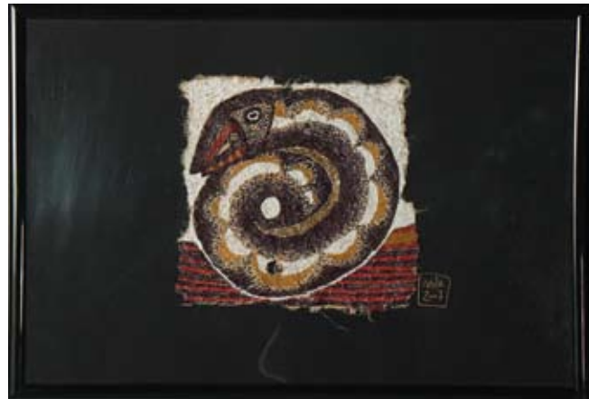
МИЛЕНА АТАНАСОВА АРТЕФАКТ III 10 x 11 CM