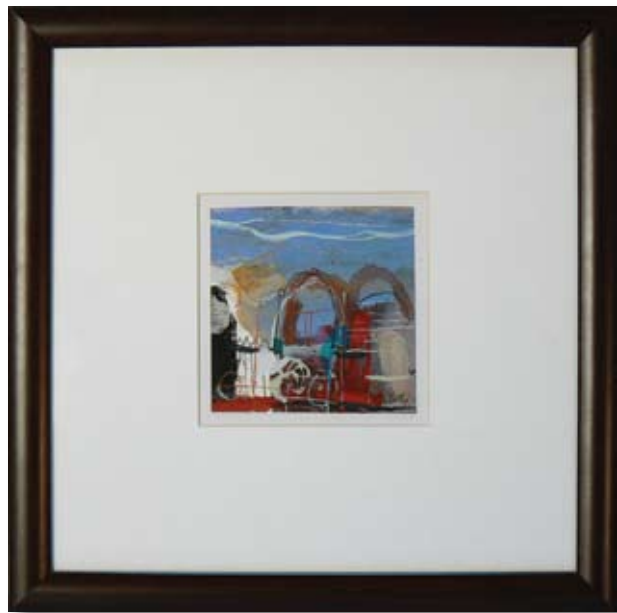
ПЛАМЕН БОНЕВ МОТИВ II 10 x 10 CM