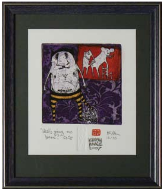
КАЛОЯН ИЛИЕВ WHAT'S GOING ON HERE 10 x 10 CM