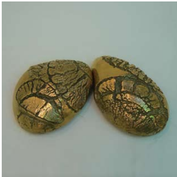
ПЕТЪР ИВАНОВ ДИЧЕВ ДИПТИХ „МОРСКА ПРЕМЯНА“ 10 x 10 x 3 CM