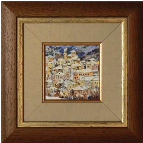
ЖАКЛИНА ЯМЕЛИЕВА ЗИМНО ТЪРНОВО 10,5 x 10,5 CM