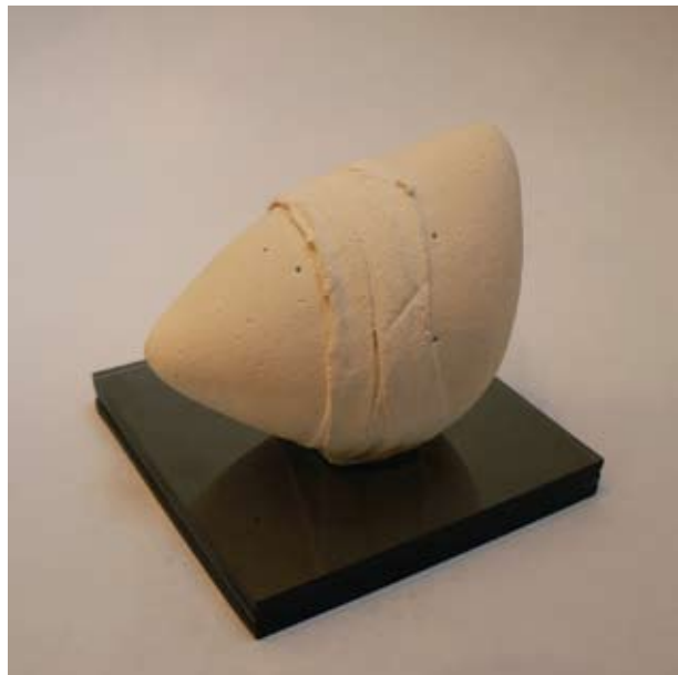
РОСИЦА ТРЕНДАФИЛОВА ДИМИТРОВА SOS - 4 10 x 10 x 10 CM