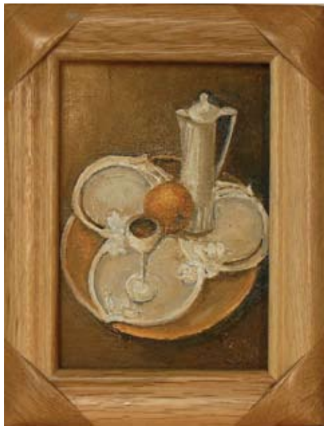
ЛЮДМИЛА ИРИНОВА НАТЮРМОРТ I 8,5 x 11,5 CM