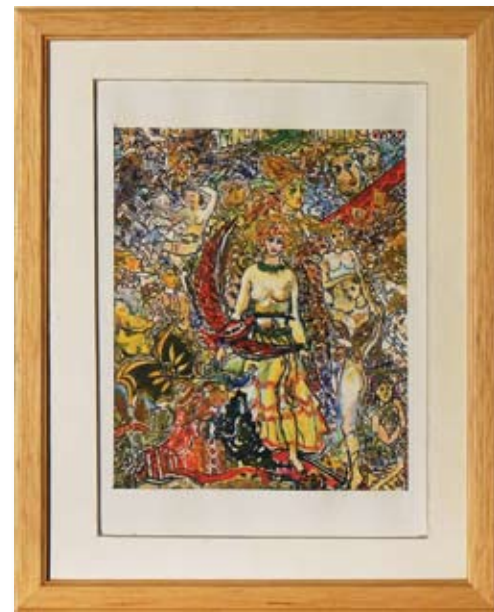
НИКОЛАЙ МИЛАНОВ ПРОЛЕТНО ТАЙНСТВО 9,5 x 11,4 CM