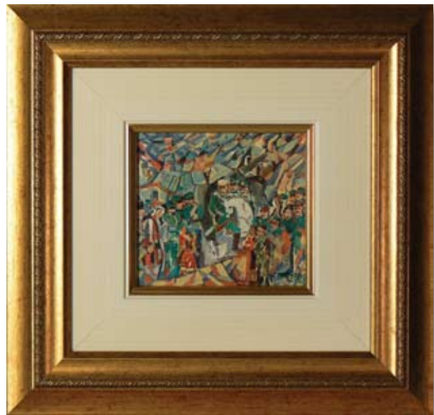
СТАНЧО СТАНЧЕВ ОСВОБОДИТЕЛИТЕ 9,8 x 10,8 CM