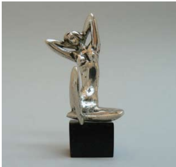
ГЕОРГИ РАДУЛОВ „ТОАЛЕТ“ 10 X 4 X 4 CM