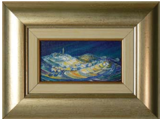
ГЕОРГИ СТОЙЧЕВ ЗИМА 13,8 x 7 CM