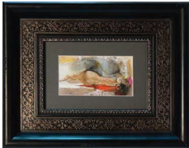
ПЛАМЕН МОНЕВ „АКТ I” 11,5 X 6,3 CM

НАГРАДА НА СБХ PRIZE OF THE UNION OF BULGARIAN ARTISTS