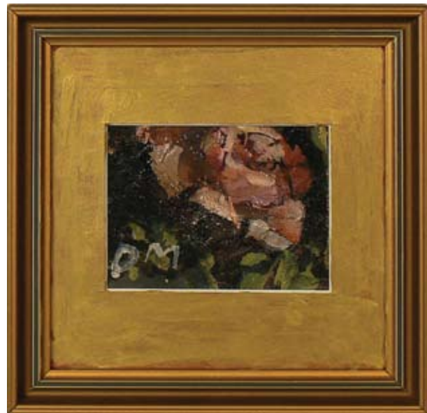
ДАНИЕЛА МАКСИМОВА-ПОПОВА РОЗА 10 x 7,5 CM