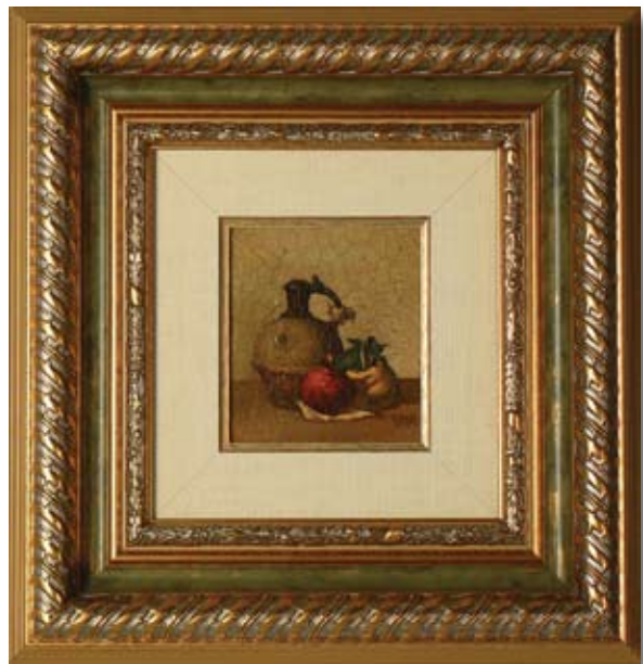
ЙОРДАН АНГЕЛОВ НАТЮРМОРТ С НАР И ДЮЛЯ 9 x 10 CM

YORDAN ANGELOV STILL LIFE WITH POMEGRANATE AND QUINCE 9 x 10 CM