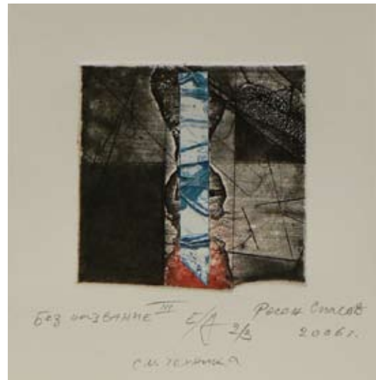
РОСЕН СПАСОВ „БЕЗ НАЗВАНИЕ III” 9,5 X 9,5 CM