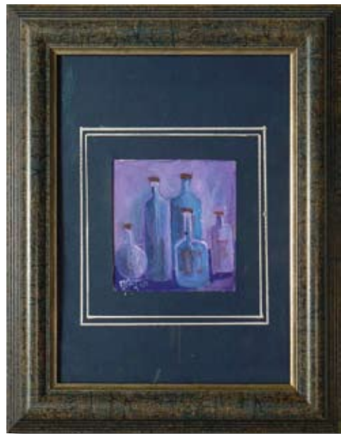
ВОЛОДЯ КАЗАКОВ НАТЮРМОРТ 10 X 10,5CM