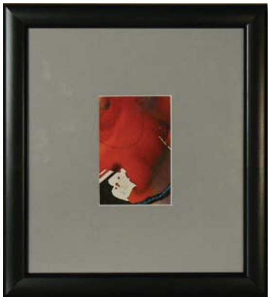
КЛИМЕНТ АТАНАСОВ РИСУНКА 202 7,2 x 10,8 CM

KLIMENT ATANASOV DRAWING 202 7,2 x 10,8 CM