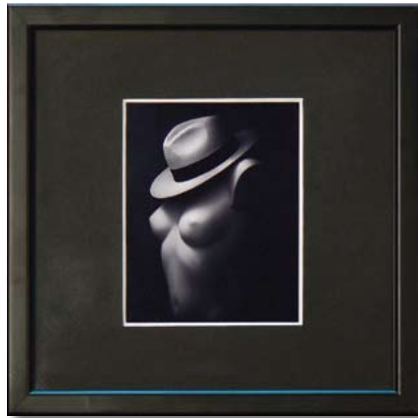
ИВЕЛИН ИВАНОВ PLASTIC 10 x 10 CM