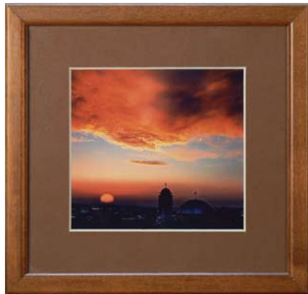
ИВАН НЕДЕЛЧЕВ ЗАЛЕЗ 11 x 10 CM