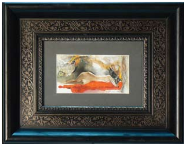
ПЛАМЕН МОНЕВ „АКТ II” 11,5 X 6,3 CM

НАГРАДА НА СПОНСОРИТЕ "DARKO" SPONSORS PRIZE