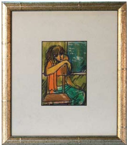
ГРИША КУБРАТОВ МЕЧТАНИЕ 4 x 6,5 CM