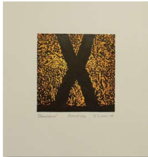
ВАЛЕНТИН ЛЕКОВ UNKNOWN 10,5 X 10,5 CM