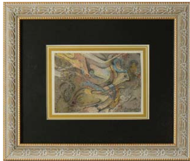
ХРИСТО КОСТОВ ВЕЛЧЕВ КОМПОЗИЦИЯ 3 8 x 12 CM