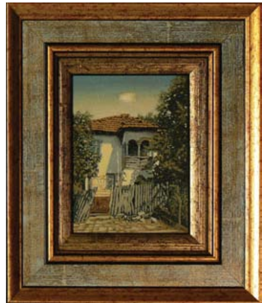
ПЕТЪР ЙОНЧЕВ КЪЩА ОТ РАКОВИЦА I 12 x 9 CM