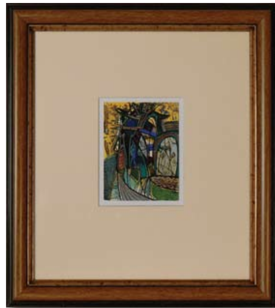
ГЕОРГИ ДИНЕВ КРАЯ НА АПРИЛ I 7,5 X 10 CM