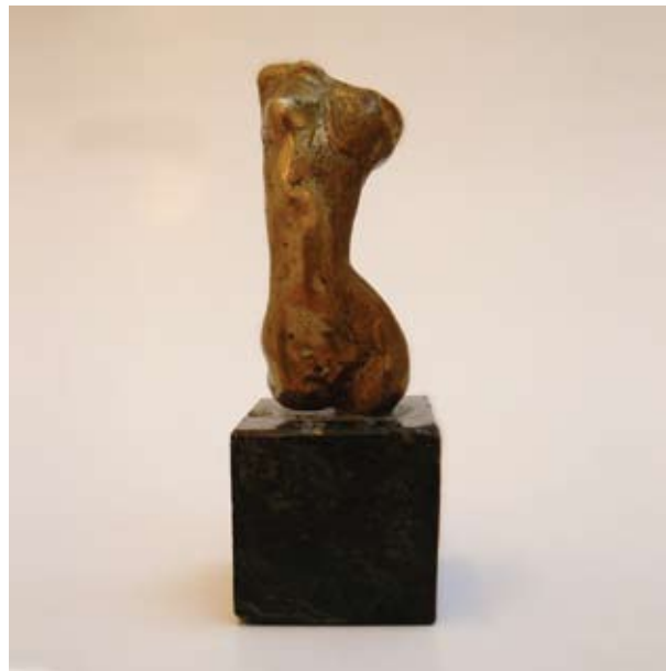
СОНЯ ЧУРОВА ТОРС I 2 x 5 x 2 CM