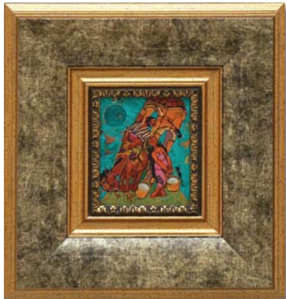
ГАНЧО КАРАБАДЖАКОВ „ЗАДЯВКА“ 10 X 12 CM

НАГРАДА НА СПОНСОРИТЕ "PRECIZAL" SPONSORS PRIZE