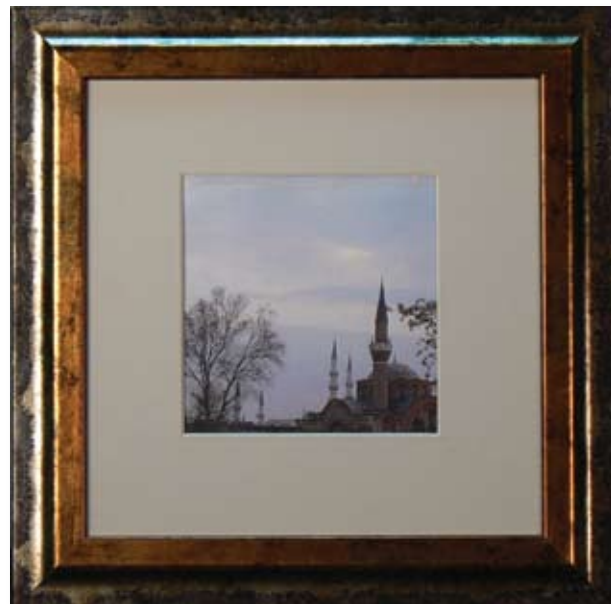
ЙОРДАН ЙОРДАНОВ УТРО 10 x 10 CM