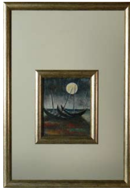
ПЛАМЕН НИКОЛОВ ОТЛИВ 9 x 11 CM