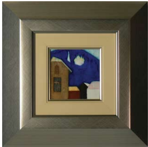
СТЕФАНКА СТОЙЧЕВА ШИПКА 9,6 x 9,7 CM