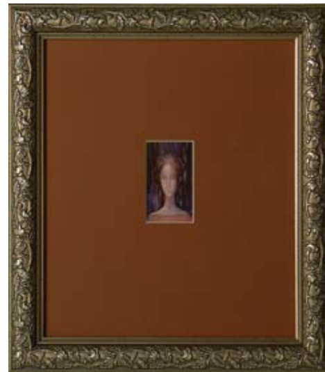
АНГЕЛИНА АНГЕЛОВА НИМФА 3,5 X 6 CM