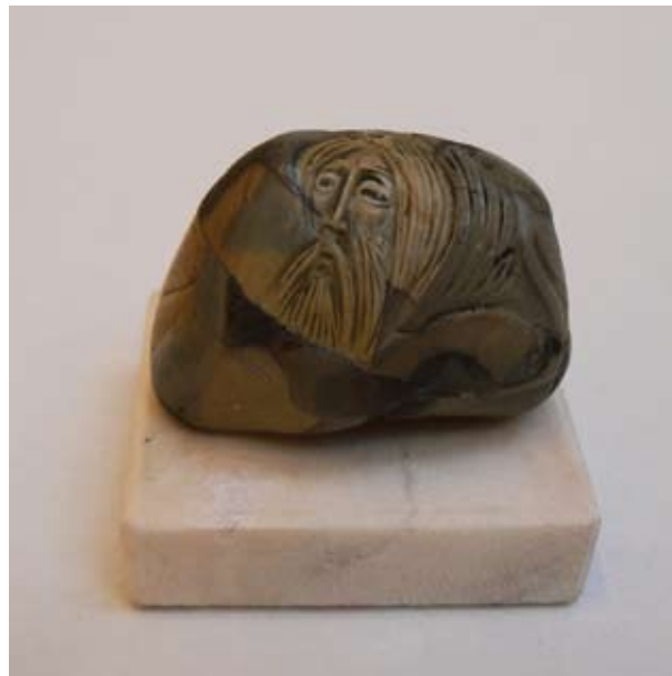
СТЕФАН ЛАЗАРОВ СЪЗЕРЦАНИЕ 6 x 5,5 x 4,7 CM