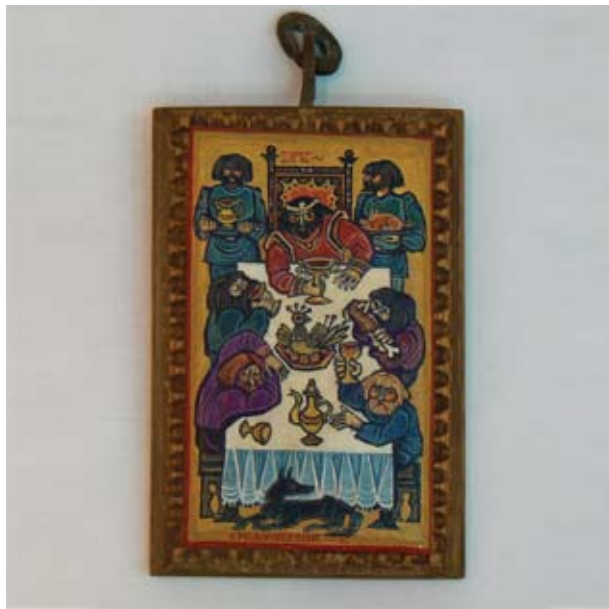
БРАНИМИРА ТОДОРОВА СРЕДНОВЕКОВИЕ I - ПИРЪТ 6 X 8 CM