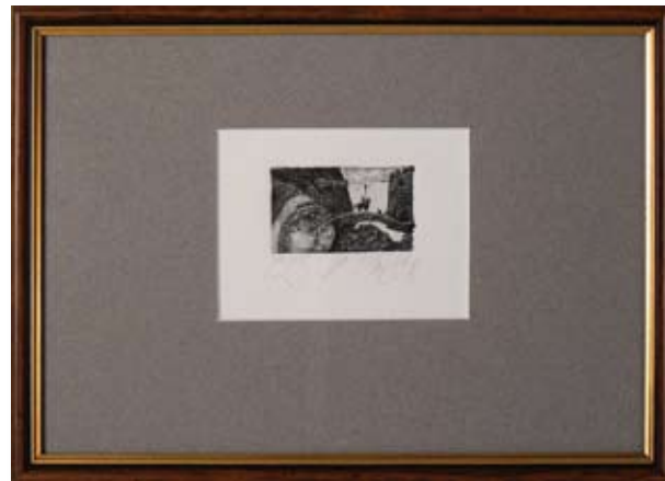
ГОРАН ПАМУКОВ 1393 4 X 6,5 CM