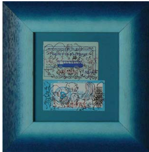
ГЕРГАНА БАБИКОВА - КАРЛОВСКА ГРАДСКИ ТРАНСПОРТ №1 9 x 8 CM

GERGANA BABIKOVA - KARLOVSKA CIVIL TRANSPORT №1 9 x 8 CM