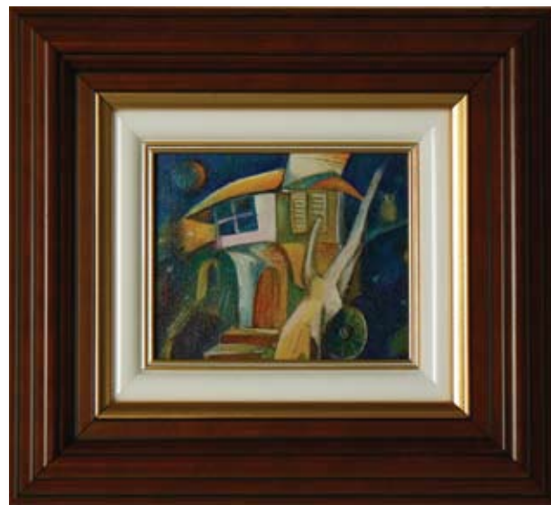
МАНЬО МАНЕВ НОЩ 8,7 x 10,7 CM