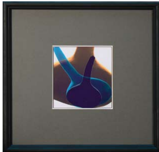
МЛАДЕН МИЛАНОВ „НАТЮРМОРТ 1“ 10 X 11 CM